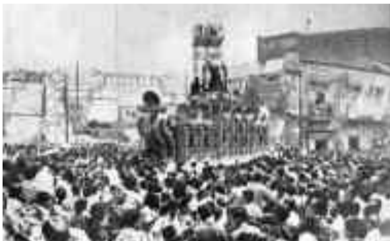
Una foto storica della festa, tratta dal libro

Della Congregazione abbiamo certezza della sua esistenza già agli inizi del 1500 grazie ai benefici concessi da Papa Leone X. Nel corso del tempo tale fu la devozione popolare sorta intorno al simulacro che si arrivò nel 1749, alla sua prima Incoronazione. Non era una cosa semplice una Incoronazione Mariana. Era frutto di una lunga