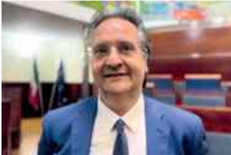
Il sindaco di Giugliano Nicola Pirozzi

“Nel giorno del mio insediamento alla carica di sindaco della nostra città uno dei miei primi pensieri è stato rivolto alla “Madonna della Pace”. Da troppo tempo il primario luogo della nostra fede, dove è racchiusa la nostra storia e la nostra devozione Mariana, era e, purtroppo, ancora è, in uno stato di provvisorietà costituita dalla impalcatura in ferro che, ormai, da oltre 20 anni occupa la navata del santuario della Annunziata, attraverso la quale si accede alla cappella della Madonna della Pace la nostra Zingarella. La mia fede mi impone, ora che rivesto un ruolo di rappresentanza della intera città, di smuovere le acque e fare quanto in mio potere e concesso dalla mia carica per riportare il Santuario, la festa di Pentecoste ed il “Volo dell’angelo” alla importanza che meritano. Ho avviato vari tavoli di confronto e di iniziativa. Immediatamente ho dato disposizione di avviare le procedure per l’inserimento della festa di Pen-