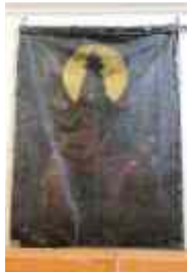
L’antico stendardo di cuoio della Congrega