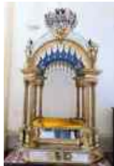
La conca dove viene posto il simulacro