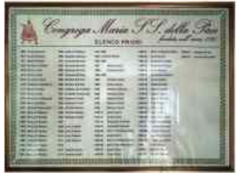
L’elenco dei vari priori che hanno guidato la Congrega nel corso degli anni