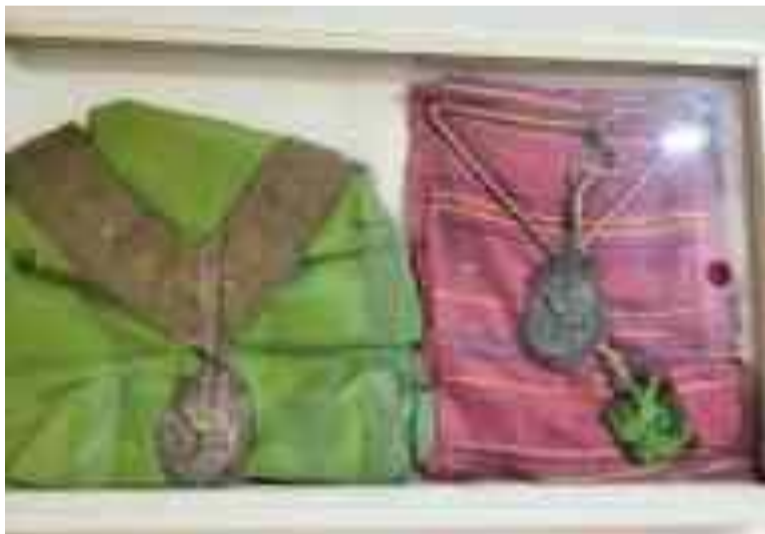
Due storici scapolari appartenuti ai confratelli della Congrega

con i membri “storici” ed i giovani. Ma non solo, anche collaborazione e formazione attraverso attività culturali e di volontariato. Vorrei che si pensasse alla Congrega come ad una parte della cittadinanza attiva dedita socialmente ma soprattutto devota alla Madonna, perché insieme alle luci della festa, alle mandorle caramellate delle bancarelle ed ai palloncini che colorano il cielo, c’è la solennità e il decoro del culto religioso e della preghiera”.