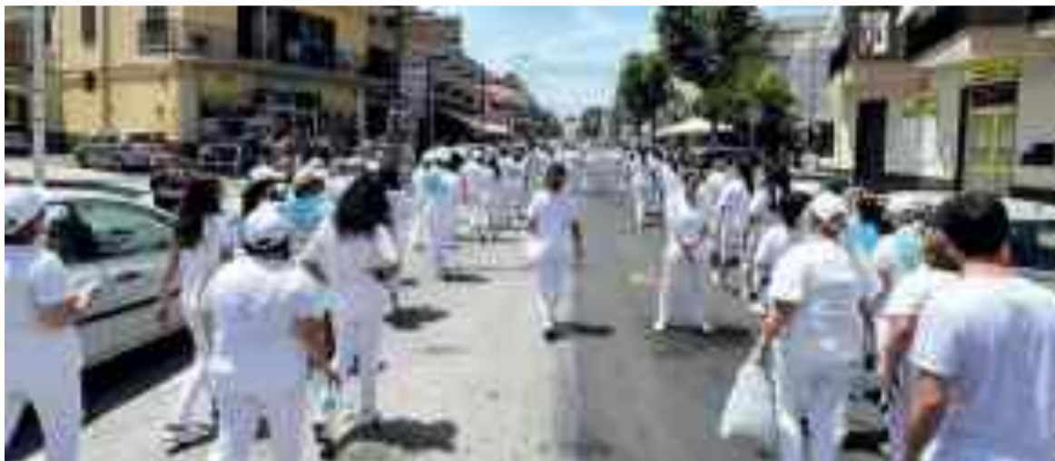
Le strade di Giugliano colorate di bianco per il corteo delle donne devote a Madonna della Pace

festa al suo carattere agricolo e femminile è la processione penitenziale che le "biancovestite" effettuano seguendo per tutta la giornata il carro in processione per le vie della città e che al ritorno nel santuario, dopo il volo dell'angelo, molte