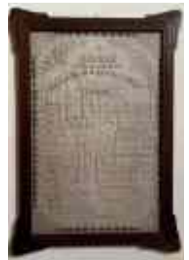
L’antico regolamento della Congrega